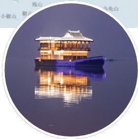
太湖隧道“画舫”风亭