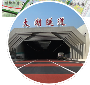
太湖隧道入口