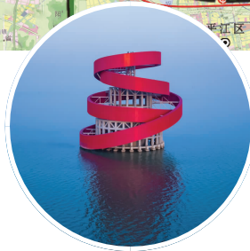
太湖隧道“碧玉螺”风亭