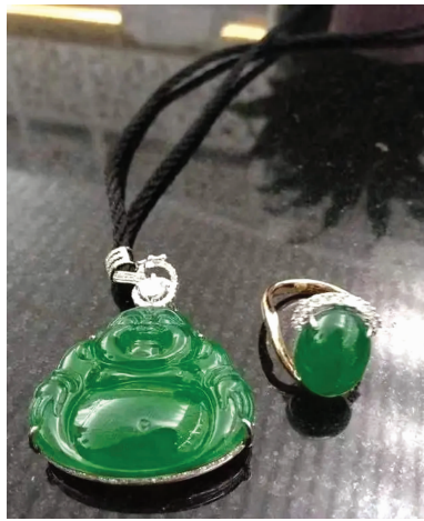
被盗的翡翠吊坠

门欧洲坊购买。购价736000港币)、一枚钻戒(8.37克拉、2011年11月25日在香港弥敦道周大福购买,购价1162545港币)及三块翡翠饰品,五件被盗物品价值共计约人民币700万元。