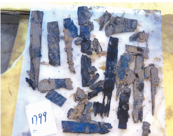
墓中刚出土的残牍

其中一枚木牍上的文字为“愿下公卿博士议制曰下丞相博士中二=千=石=臣吉臣望之臣昌臣……”(注:“=”为重文号)。这里的“制”代表皇帝,“制曰下某官”是皇帝批示的一种程式。木牍的大致意思是:汉宣帝下诏书给丞相和博士