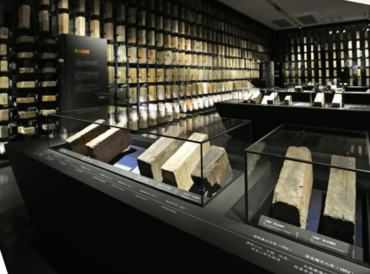
城墙砖组成的展示矩阵