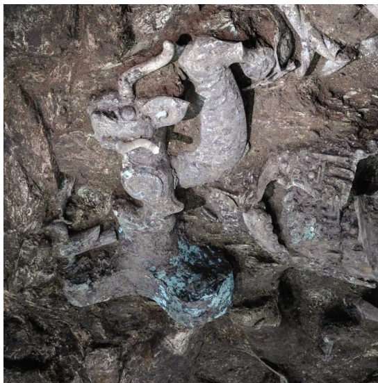
“虎头虎脑”的青铜龙

据央视新闻官微报道,近日,三星堆8号坑发现一件“虎头虎脑”的龙形青铜像,是中国青铜时代的其他遗址里,从未发现过这种器物。