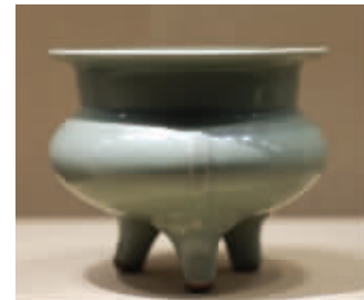
龙泉窑青釉高式炉

12月18日，由浙江省博物馆与南京博物院携手打造的跨年大展“宋韵——士大夫的精神世界”在南京博物院特展馆开展。现场，来自38家考古文博机构收藏的约300件宋代文物精品，讲述了宋代士大夫们的故事。