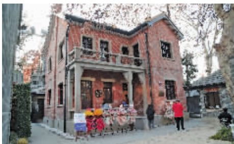
◀◀ 颐和路十一片区改造完成