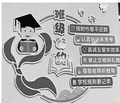
班级公约各有特色

随着新教育实验的深入推广,睢宁县实验小学四年级成为第一批试验班级,师生们积极投入行动之中,向“缔造完美教室,书写生命传奇”的实验里程碑不断迈进。