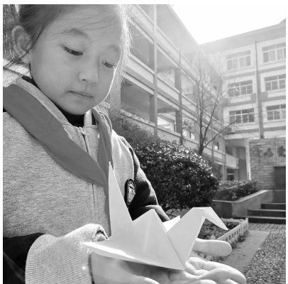
放飞纸鹤祭奠死难者