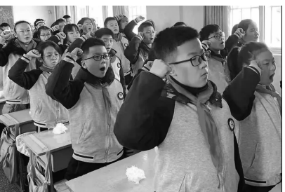
庄严宣誓:自强不息,砥砺前行,圆梦中华!

12月13日,是南京大屠杀死难者国家公祭日,徐州市睢宁县实验小学组织开展了国家公祭日主题教育活动。