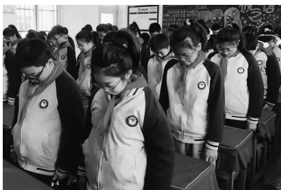
为南京大屠杀死难者默哀