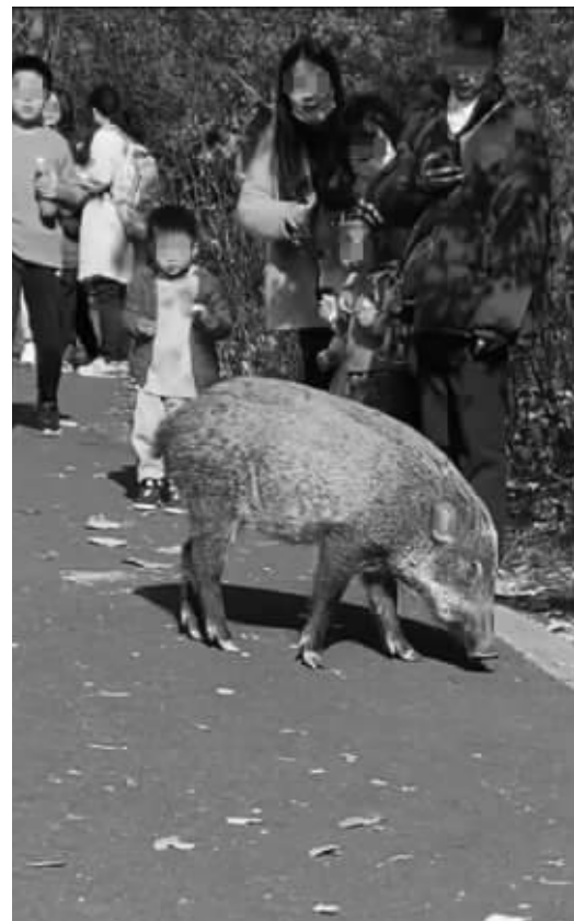
野猪在南京频频现身,不仅跑上公路、闯进校园,还溜进景区闲逛 现代快报资料图片