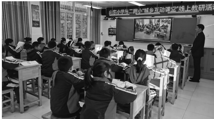
山东小学学生在结对互动课堂上

今年5月8日，连云港市正式启动城乡结对互动课堂市级试点工作，遴选8所市级试点校开展“1对1”结对共建。截至目前，已经开展了16周的城乡结对试点工作，共有110名教师参与城乡结对互动课堂的执教工作中，已开展城乡结对互动课堂课程128节。