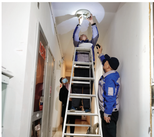
永宁雅苑，物业接到业主报修，立即上门维修