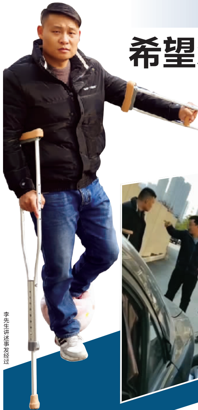
李先生讲述事发经过