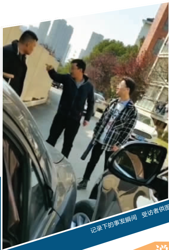
记录下的事发瞬间