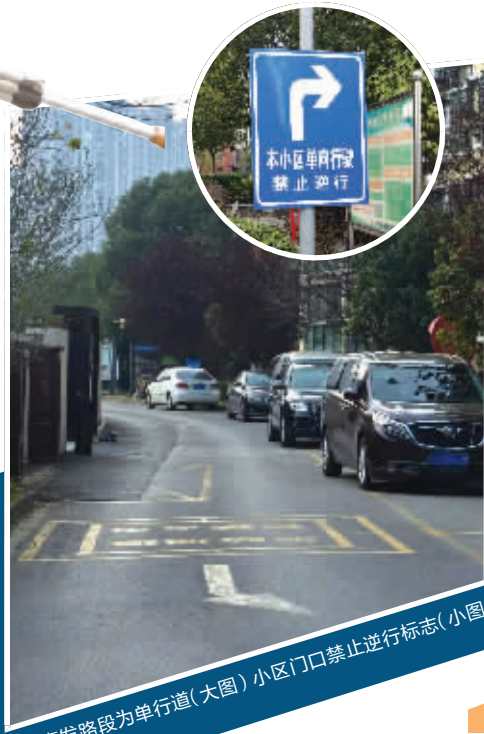
事发路段为单行道(大图) 小区门口禁止逆行标志(小图)