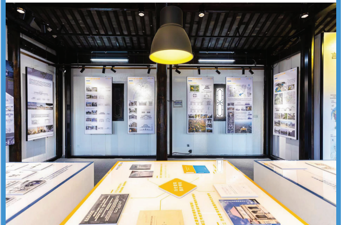
亚洲文化遗产保护成就展

作为第九届南京历史文化名城博览会的首场系列活动，展览和研讨会由联合国教科文组织、南京历史文化名城博览会组委会、东南大学联合主办，由南京市规划和自然资源局与东南大学建筑学院共同承办。