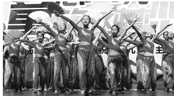
校园儿童节主题活动