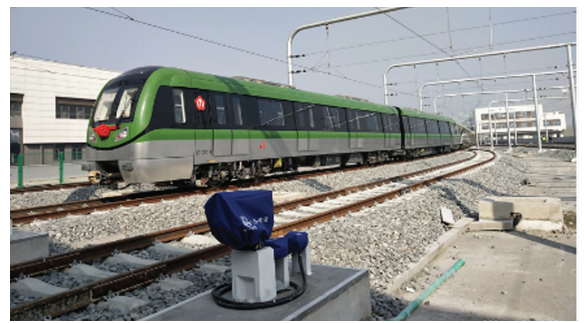
地铁7号线首列车顺利交付

快报讯(通讯员 地轩 记者 刘伟娟)12月1日，现代快报记者从南京地铁获悉，地铁7号线首列车于2021年11月26日顺利到达马家