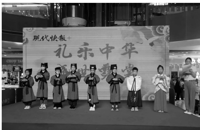
小记者学国学、习礼仪

“弟子规，入则孝，出则悌，谨而信，泛爱众，而亲仁……”中华经典诗文充斥整个现场。小记者们的齐声诵读，仿佛穿梭到了中华五千年薪火相传的历史长河中，梦回千年。