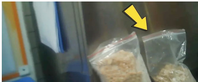
用于制作麻婆豆腐的肉沫已经发酸 视频截图

B站UP主“内幕纠察局”11月29日上传暗访吉野家门店的视频,曝光吉野家(某店)不仅存在售卖过期食材、使用发酸发臭的肉沫及巴沙鱼等食材,还存在油质严重发黑、每周才更换一次以及一系列不规范操作和严重卫生问题。