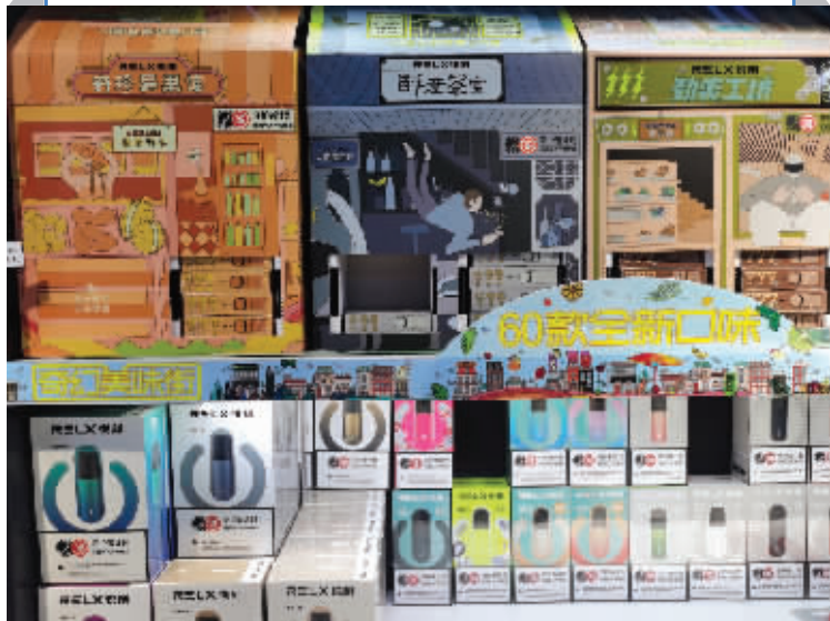
门店里卖的电子烟各式各样