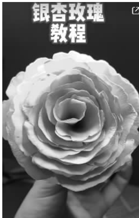
银杏叶制作成的玫瑰