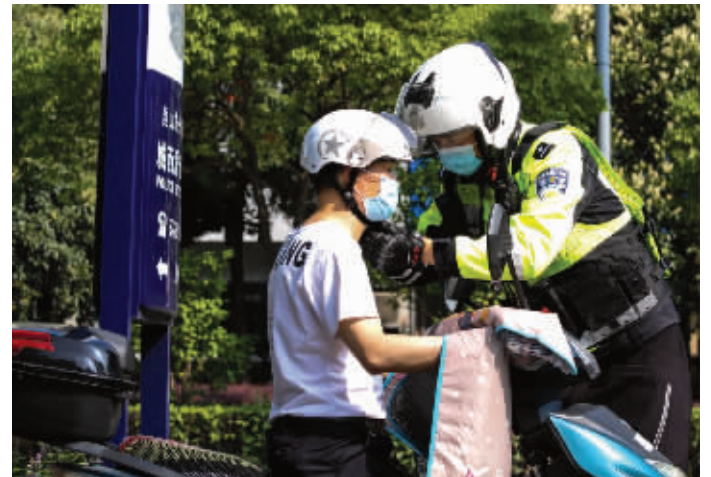
执勤交警在帮骑行市民规范佩戴头盔

十年来全省道路交通事故起数和死亡人数却在逐年降低。数据显示,2020年全省道路交通事故起数与2012年相比,下降20.3%。此外,自2011年醉驾入刑以来,醉驾违法犯罪比例逐年递减,万车查获酒驾率下降70%。