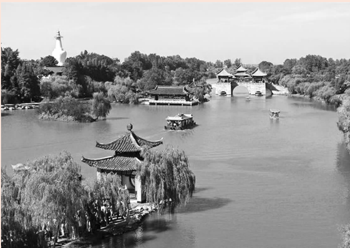
瘦西湖风景区