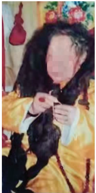
女子装扮成“慈禧太后”的照片 通讯员供图