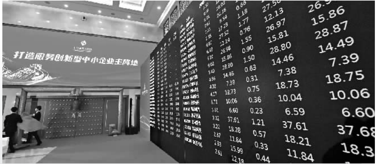
北京证券交易所揭牌暨开市仪式现场