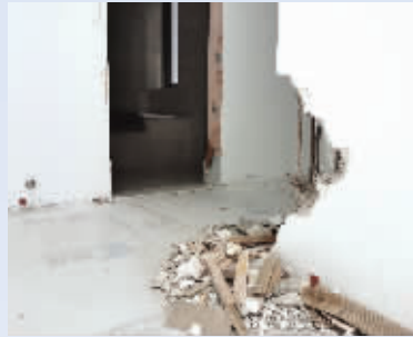
主卧室衣帽间墙体被砸掉一大块