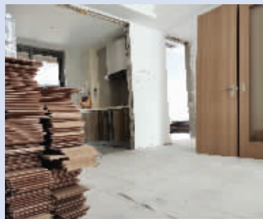
新房被拆后，跟毛坯房差不多了