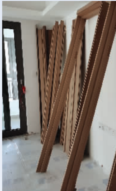
拆下来的门套等部件