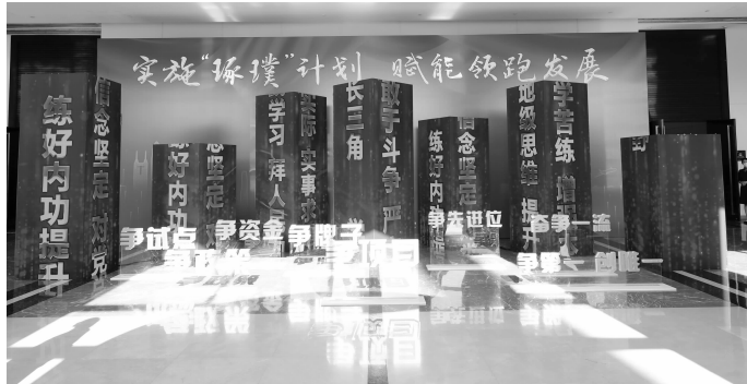
动员大会现场

从学习锻炼渠道方向看,选派14名到国家部委、9名到省级机关升维锻炼;选派37名到雄安新区、