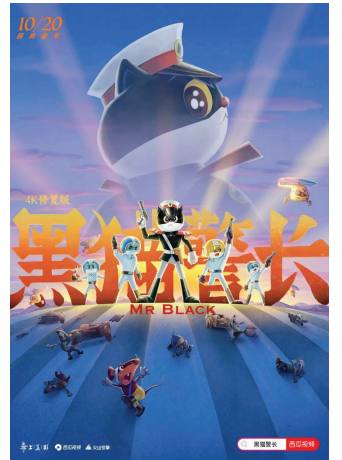
《黑猫警长》海报

如今，4K修复技术结合AI，降低了一系列修复成本，科技创造与旧时影像融合出奇又质朴的艺术效果，为文化传承提供新思路。