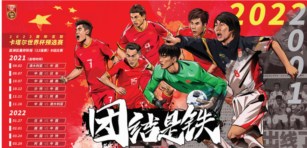
国足的出线希望能保留到第几轮？