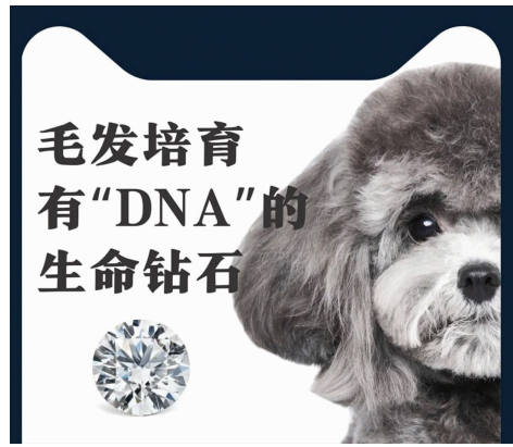
毛发培育有“DNA”的生命钻石