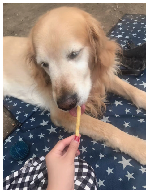
这只狗狗已经去世,主人定制了人工钻石戒指纪念它 网络截图