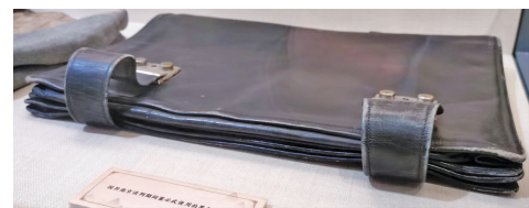
国共南京谈判期间董必武使用过的黑色公文包