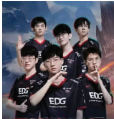
珠江投资也火出圈 微博截图