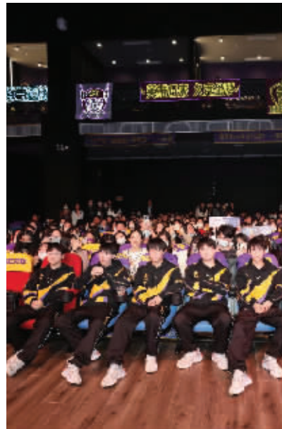
南京Hero久竞比赛资料图

现代快报记者了解到,近日发布的《2021年游戏产业发展趋势报告》指出,2021年中国游戏市场实际销售收入预计将超2900亿元,2021年中国自主研发游戏海外市场实际销售收入有望突破170亿美元。