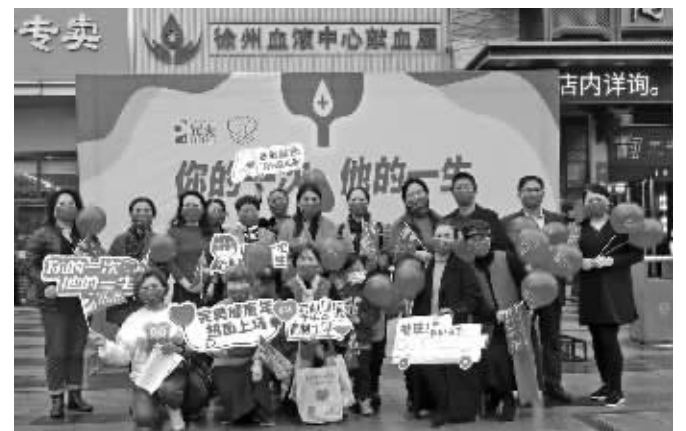
活动现场

11月6日,完美(中国)有限公司江苏分公司与徐州市血液中心共同举办的无偿献血活动在徐州温暖启动。本次活动名为“你的一次他的一生”第18届完美“百城千店万人徐州站”无偿献血活动。