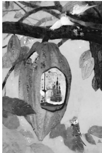
万蕊《可可树上的甜美假期》 100×70cm 麻纸 矿物颜料 金箔