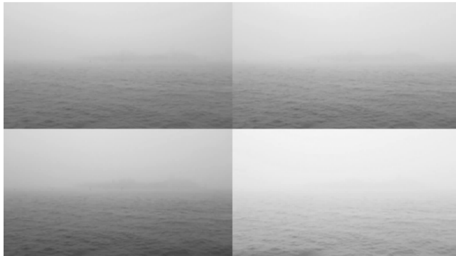
陈东彦《Oceanus》单频高清影像