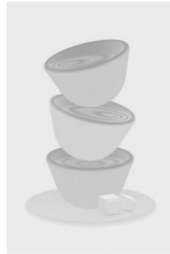
赵洁《日常·咖啡》50×70cm 数码喷绘