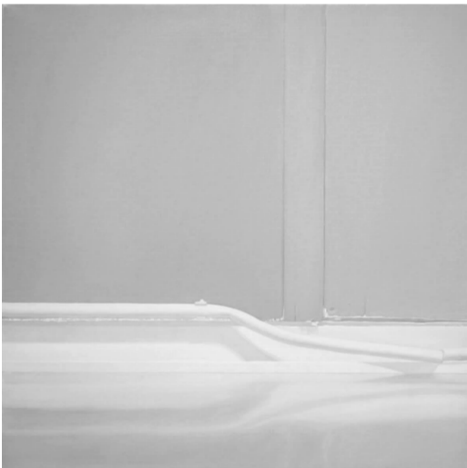
冯保力《情感7》50×50cm 布面油画