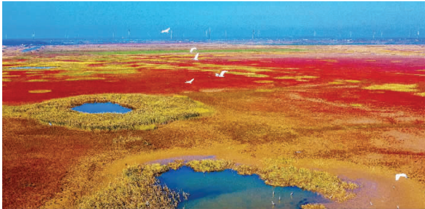
条子泥湿地如同打翻的调色盘