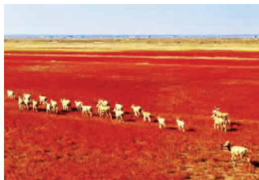
麋鹿在火红的盐蒿丛中奔跑

记者了解到,盐蒿是菊科、蒿属小灌木,是良好的固沙植物之一。这些原始的盐蒿滩上盛产螃蟹、蛤类等底栖生物,让不少候鸟来此停留栖息觅食。这里,已成为它们流连忘返的“天堂乐园”。