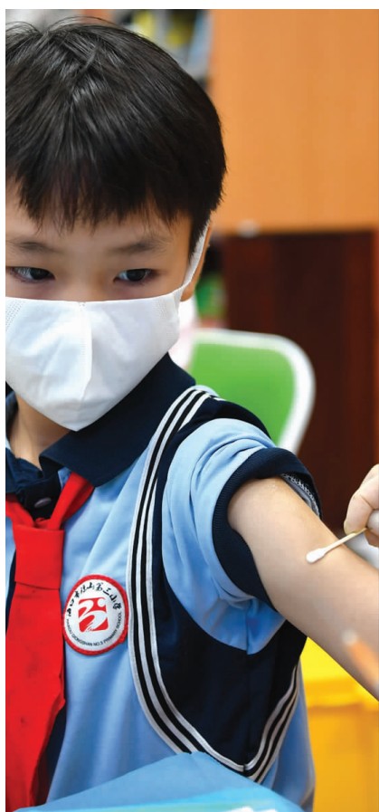
10月28日,海口市琼山第三小学的学生接种新冠疫苗

现阶段3-11岁人群使用的疫苗包括国药中生北京公司、北京科兴公司、国药中生武汉公司的灭活疫苗,灭活疫苗的免疫程序为两剂次,即接种两针,中间间隔3到8周。