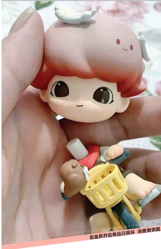
盲盒拆开后发现损坏