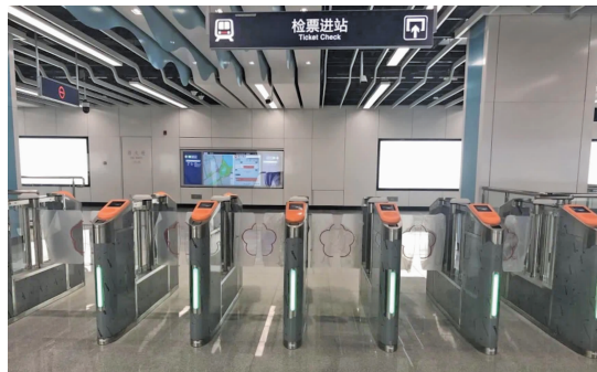
车站里使用的新式摆门闸机

还没开通运营，南京地铁2号线西延线“网红”气质已爆棚。10月19日，现代快报记者从南京地铁获悉，2号线西延线车站从功能到设计，处处透着智慧，待年底开通后将成南京“人气打卡点”。现在，一起来看看“剧透”吧！