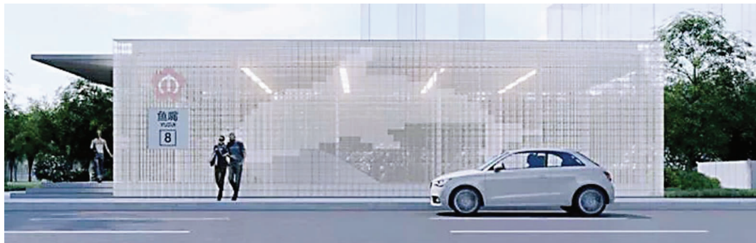
2号线西延线鱼嘴站的3号、8号出入口位于鱼嘴CBD核心区，这两个出入口采用了玻璃砖立面造型