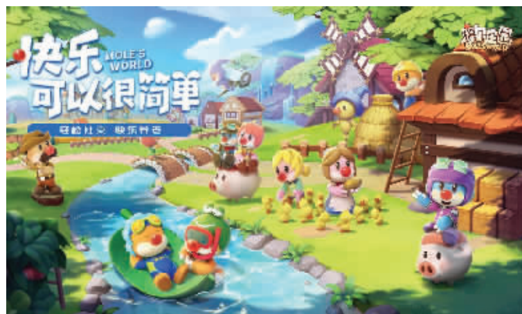
淘米集团开发的《摩尔庄园》手游 游戏页面截图

如果此次收购完成，对巨人网络而言，意味着将获得《征途》之外又一批重要IP。而对淘米集团而言，意味着其将曲线登陆A股市场，两家昔日的中概股游戏公司将在A股“会师”。