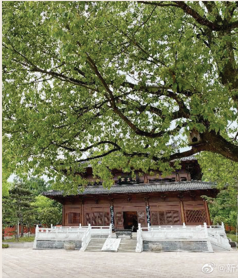
吴越国王陵景区