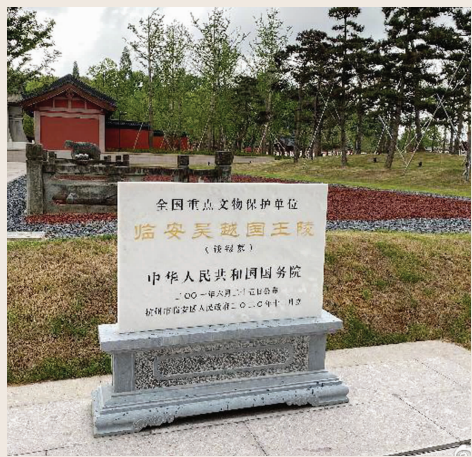
吴越国王陵景区 据新华社微博