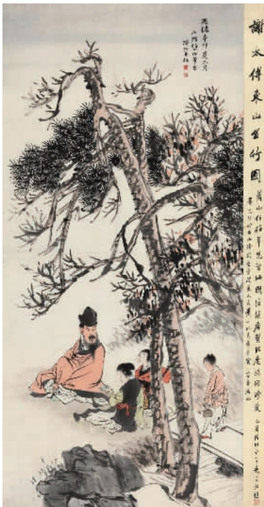
清 任颐《谢太傅东山丝竹图》