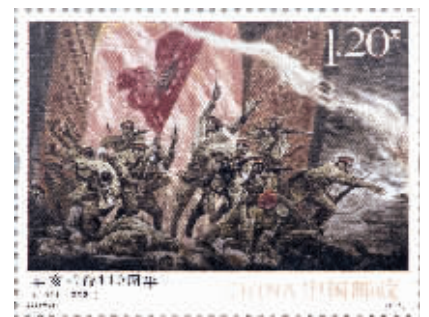
《辛亥革命110周年》纪念邮票

快报讯(通讯员 芮姣 记者 赵丹丹)10月10日,现代快报记者获悉,当天《辛亥革命110周年》纪念邮票正式发行,一套1枚,全套邮票面值1.20元,邮票共计发行数量为670万套。