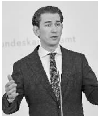
库尔茨出席记者会