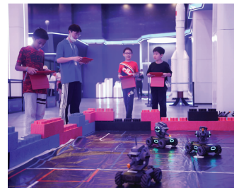
孩子在现场体验