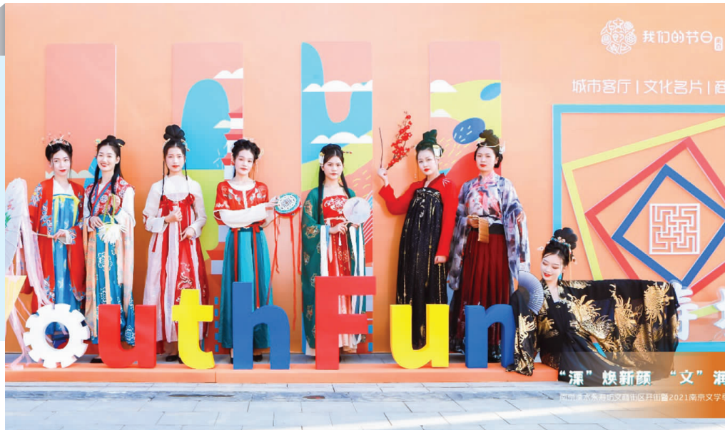
永寿坊文化商业街区开街