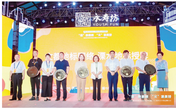
授予“世界文学之都地标”铭牌

在“天下文都”板块,南京国际文学家驻地计划作为南京“文学之都”建设常态化重点项目,从10月起将邀请南京本地知名文学家和世界文学之都城市的文学家,在各自城市标志性的文学空间进行线上对话,探索文学在城市发展中所扮演的角色。2021年11月,“一带一路”青年创意与遗产论坛将第四次落地南京。