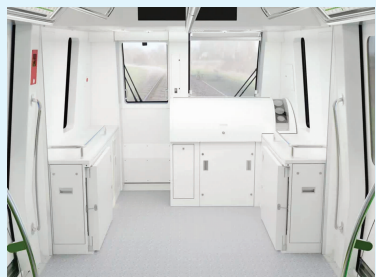
7号线无人驾驶舱

快报讯(记者 刘伟娟)9月30日,现代快报记者从南京地铁运营有限责任公司七号线分公司获悉,南京首条无人驾驶地铁——7号线列车亮相,车身为草绿色。