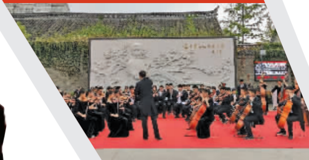
南京江宁区秣陵街道翠屏城园亲子朗诵社朗诵《永远的梅园》