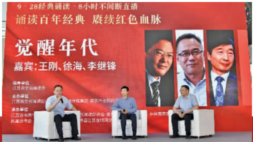
9·28经典诵读·8小时不间断直播 诵读百年经典 赓续红色血脉