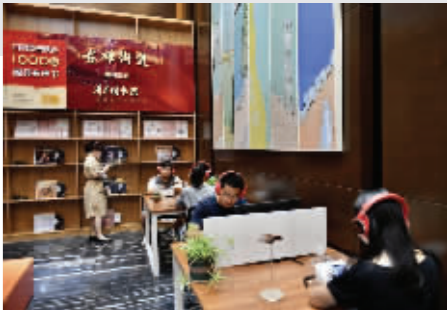
南京雨花台区古雄街道有声图书馆