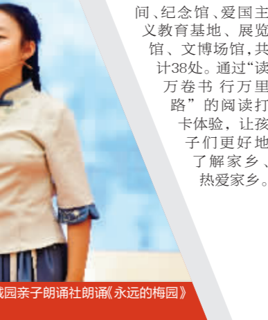
常州分会场活动现场朗诵《英雄颂》

记者了解到,在每年的淮安周恩来读书节启动仪式上,市委宣传部门向学生发起了“阅读地图体验打卡”行动,阅读地图共收录了各类公共图书馆、城市书房、阅读空间、纪念馆、爱国主义教育基地、展览馆、文博场馆,共计38处。通过“读万卷书 行万里路”的阅读打卡体验,让孩子们更好地了解家乡、热爱家乡。