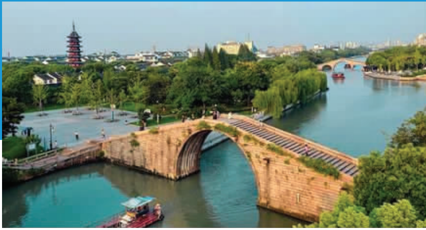
大运河横穿保护区、姑苏区