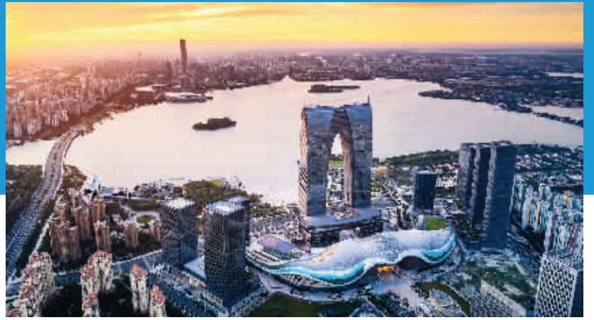
苏州工业园区