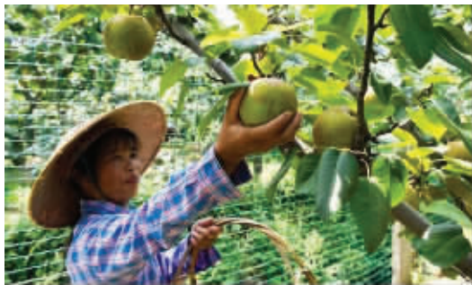
树山村的梨子大丰收

近日,现代快报记者来到中国乡村研究的样本地——苏州吴江开弦弓村,也是费孝通笔下的江村,这里小桥流水,粉墙黛瓦,人家枕河而居。开弦弓村自古就有家家种桑养蚕的传统,是出了名的桑蚕之村。不过因销路不畅,当年经济发展相对滞后。