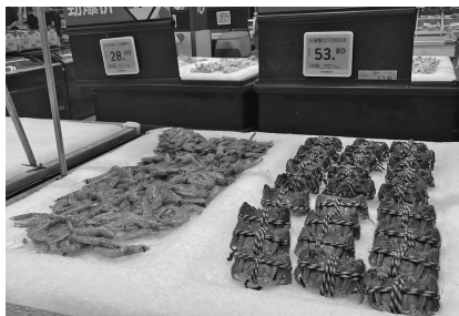
超市里销售的大闸蟹