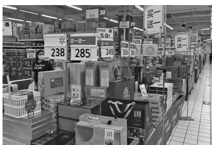
超市里月饼打折促销