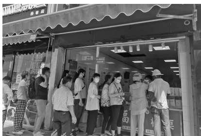
栗子店门口排长队