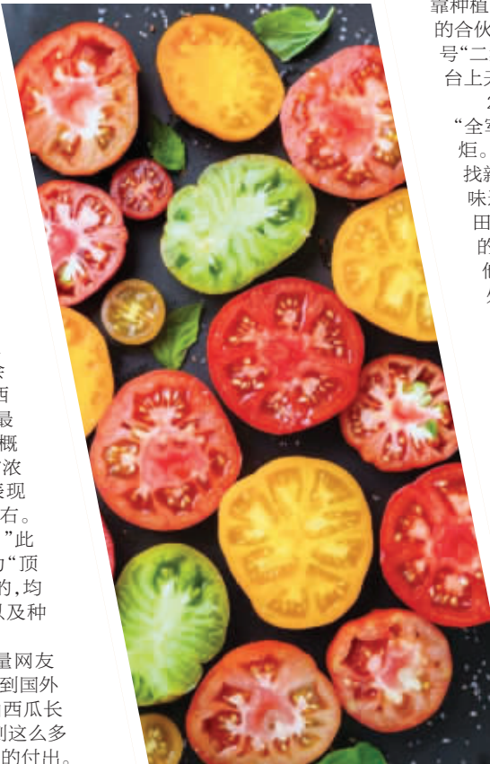
不同品种的番茄切片