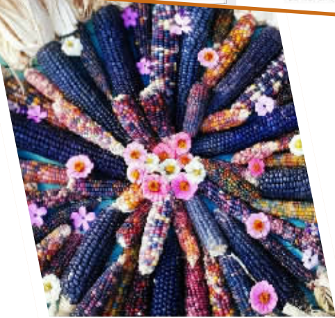
颜色各异的宝石玉米