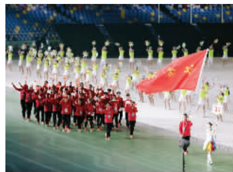
江苏省体育代表团在入场仪式上

最后一棒是为中国代表团在东京奥运会上“射落”首金的杨倩,东京奥运会上,杨倩以251.8环创奥运会纪录的成绩获得射击女子10米气步枪金牌。之后她与队友杨皓然配合再获射击10米气步枪混合团体金牌,成为中国射击队自建队以来首位在同一届奥运会上收获两枚金牌的运动员。这个“大心脏、爱比心”的00后姑娘,在奥运会期间圈粉无数。在全运会开幕式现场,杨倩点燃了主火炬。