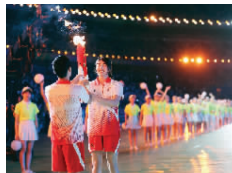
张雨霏(右)与秦凯交接火炬