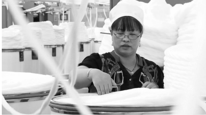
在常州工作的少数民族女工