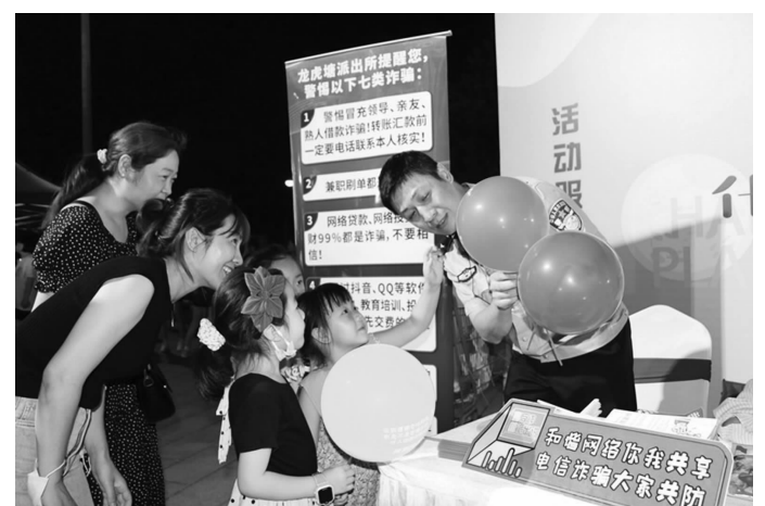
民警在夜市摆摊宣讲反诈知识,吸引往来群众驻足了解

“走一走转一转,你往我这一看……防诈骗知识免费领,免费领了啊……”此起彼伏的吆喝声、诙谐幽默的互动,顿时吸引了众多群众围观驻足,俨然成为了夜市里亮丽的风景线。