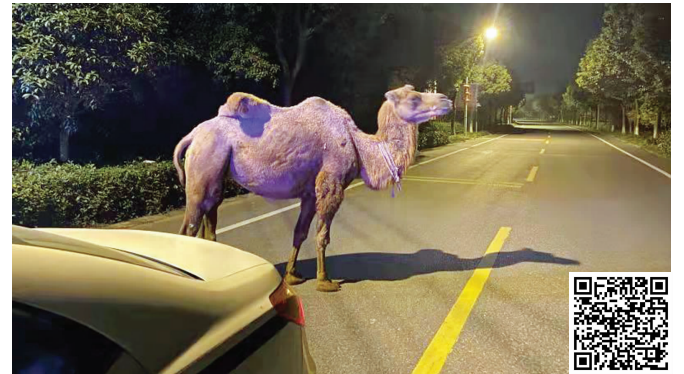
在街头闲逛的骆驼 扫码看视频

快报讯(通讯员 马媛 夏敏 记者 曹德伟)9月8日晚9点多,在镇江丹徒世业镇的马路上,出现一头骆驼的身影。当民警赶到后,也许是“逛街”累了,骆驼体力消耗过大,竟向路边的烧烤店奔去,在随后赶来的动物园工作人员的配合下,民警将吃饱喝足的骆驼安全送回了“家”。