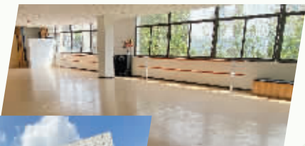
扇骨里邻里中心二楼舞蹈室

值得关注的是,在邻里中心经营模式上,秦虹街道采取PPP的合作模式,选择第三方企业合作,由企业按照街道议定的设计方案对项目内部进行装修,同时负责项目内社区商业部分及居家养老服务的运营,运营所得收入用于维持日常物业管理、卫生保洁等开支。