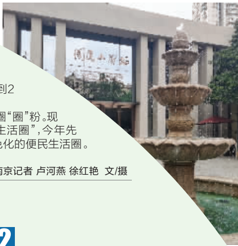
北门桥社区附近的剧场