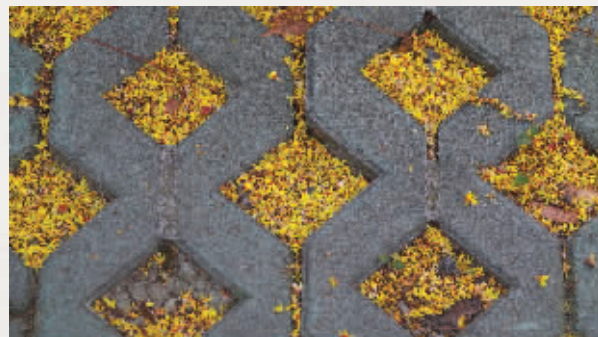
被吹落的花朵,在地上铺了一层金黄