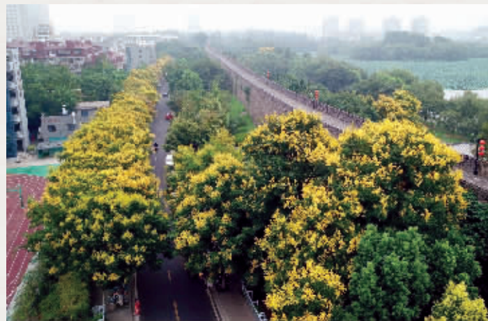
玄武门城墙边,成片的栾树长得十分高大